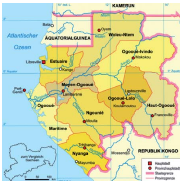
Flagge und Karten: Wikipedia

Le Gabon, pays de l'Afrique équatoriale, est traversé par l'équateur. Il est limité au nord par le Cameroun et la Guinée Equatoriale, à l'est et au sud par le Congo-Brazzaville, à l'ouest par l'Atlantique.